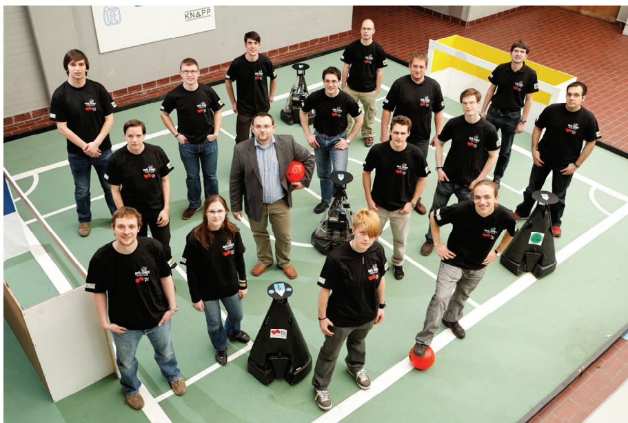
Das „Mostly Harmless“-Team der TU Graz kickt in der Middle Size League

Dass der RoboCup nach Spielorten wie Atlanta oder Shanghai heuer erstmals nach Österreich kommt, ist nicht die einzige Sensation: Auch die heimischen Roboter-Kicker werden bei den Bewerbungen ordentlich mitmischen und holen damit den Traum einer österreichischen WM-Teilnahme in die Realität. Beim RoboCup 2009, der Weltmeisterschaft der Robotik, gehen die Roboter-Teams auf Torjagd, tanzen, „retten“ Leben und erledigen den Haushalt – und das in vier Bewerbungen mit insgesamt elf Ligen. In jeder Liga wird am Ende der Spielwoche, am Sonntag, den 5. Juli 2009, ein Weltmeister-Team gekürt – gut möglich, dass ein heimisches Team dann „We are the champions“ trällert!