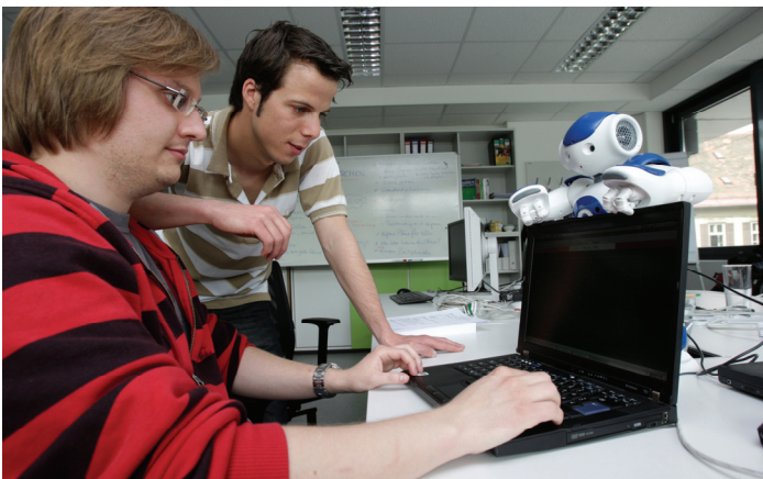
Der Blick in die Zukunft: Visionäre Vorträge am RoboCup 2009

Um einen Einblick in den aktuellen Stand der Robotik-Forschung und einen Ausblick in die mögliche Zukunft von Robotik und künstlicher Intelligenz zu geben, präsentieren sechs Vortragende ihre jeweiligen Spezialgebiete von Robotern auf dem Mars bis hin zur intelligenten Gehhilfe. Die Vortragssprache ist Englisch, alle Vorträge finden in Saal 1 des Messezentrums Graz statt.