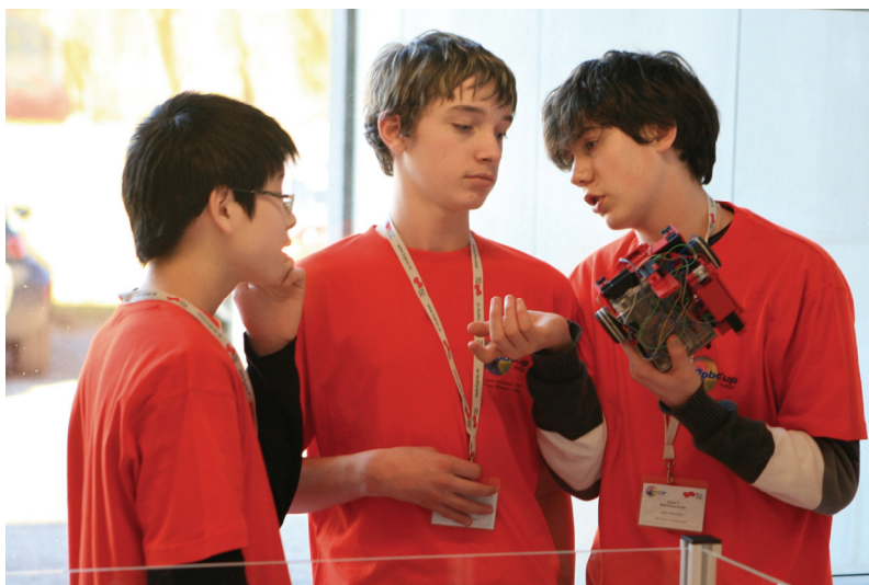
RoboCup Rescue: Roboter als Lebensretter

Die Simulationsliga ist im Prinzip ein internationales Testfeld für die Simulation von Robotern, die Such- und Rettungsszenarien in Städten durchführen. Intelligente „Agenten“ müssen in virtuellen Katastrophenwelten verschiedene Such- und Rettungsaufgaben lösen. Forschungsziel ist, durch die Integration von Katastropheninformation und -vorhersage, detaillierter Planung und der Gedankenleistung der menschlichen Einsatzkräfte wertvolle Entscheidungsunterstützung in Notfällen zu geben. Die Forschung dahinter gestaltet sich stark interdisziplinär, so zeigt sich zum Beispiel das strategische und teamorientierte Verhalten der simulierten Helfer als eine schwierige Herausforderung, an der mehrere Forschungsbereiche beteiligt sind.